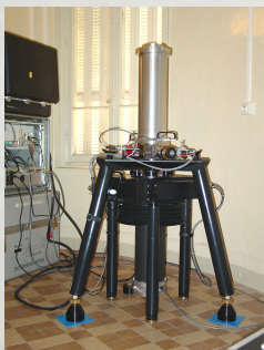
Gravimètre absolu Absolute gravimeter

Installation d'une station GPS permanente, mesures annuelles de la pesanteur (Projet GIANT : Geodesy for Ice in ANTArctica) :