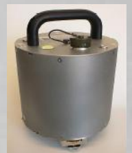
Séismomètre large bande Breedbandseismometer